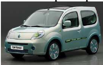
Un véhicule électrique de démonstration, le Renault Kangoo Be Bop Z.E.