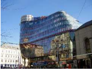
Zlatý Anděl (2001) à Prague

Jean Nouvel : né le 12 août 1945 à Fumel, dans le Lot-et-Garonne en France est un architecte français contemporain de renommée internationale.