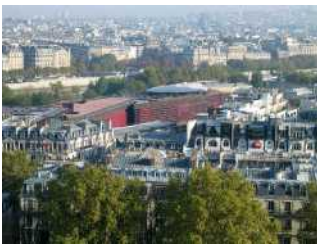
Musée du quai Branly vu depuis le premier étage de la tour Eiffel.

Epousant la courbure douce de la Seine au pied de la tour Eiffel, juché sur pilotis, prévu pour être -à terme- niché dans la verdure, le musée s'organise autour de quatre bâtiments distincts.