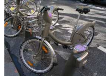
Le look très moderne des vélos.