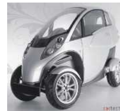
La Lumeneo Smera Un nouveau véhicule électrique de conception française, le Smera, résultat du croisement d'un scooter et d'une voiture.