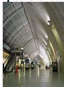
La gare d'Avignon TGV