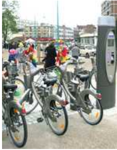
Une station, parmi les 1451, réparties dans toute la ville.

La promotion du vélo urbain s'inscrit dans un contexte de défense de l'environnement. Depuis la loi sur l'air de décembre 1996, qui a rendu obligatoire le plan de déplacement (PDU) pour les villes de plus de 100 000 habitants, les projets favorables à ce qu'on appelle les « modes doux » (vélo, rollers, marche) se sont multipliés. A Paris, la mairie a adopté en février dernier un plan qui prévoit de faire baisser de 40% la circulation automobile dans la capitale d'ici 2020, l'objectif étant de réduire de 60% l'émission de gaz à effet de serre.