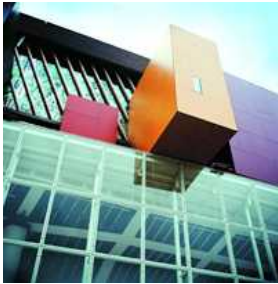
2006 : Musée du quai Branly (Musée des Arts premiers) à Paris.

Les caissons suspendus sur la façade du musée abritent les pièces particulièrement rares.